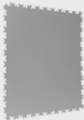
GRIS CLARO 7045