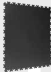
GRIS PIZARRA 7016