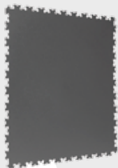
GRIS OSCURO 7015